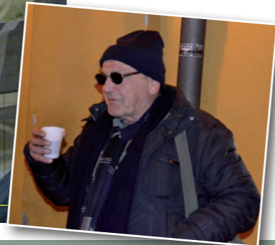
Una presenza storica di Modena di Renata Cappi

a sinistra la sala d'attesa della stazione dei treni di Modena con i numerosi volontari della Protezione Civile comunale impegnati a distribuire vari generi di conforto a lato la rivista Consumatori che ha voluto dedicare un'intera pagina all'importante iniziativa sotto Vittorio, simpatico "spirito libero" che si è raccontato con grande spontaneità