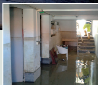
in questa foto la campagna fra Bastiglia a Bomporto completamente allagata sotto uno scantinato invaso di acqua e fango. Sul muro si può notare il livello raggiunto

Il periodo che va da dicembre 2013 a febbraio 2014 verrà sicuramente ricordato a lungo. In quei giorni, in base ai dati raccolti dalla rete di monitoraggio dei fiumi collegata con il Centro unificato di Protezione Civile di Marzaglia, si sono verificate cinque piene di Secchia e Panaro. La prima si è verificata tra il 26 e il 28 dicembre quando sul crinale sono caduti 250 millimetri di pioggia in 48 ore, portando il Secchia a Ponte Alto a quota 8.60 metri. La seconda si è verificata tra il 4 e il 7 gennaio in seguito a una precipitazione di 200 millimetri in 48 ore, che ha provocato una piena simile a quella di Santo Stefano.