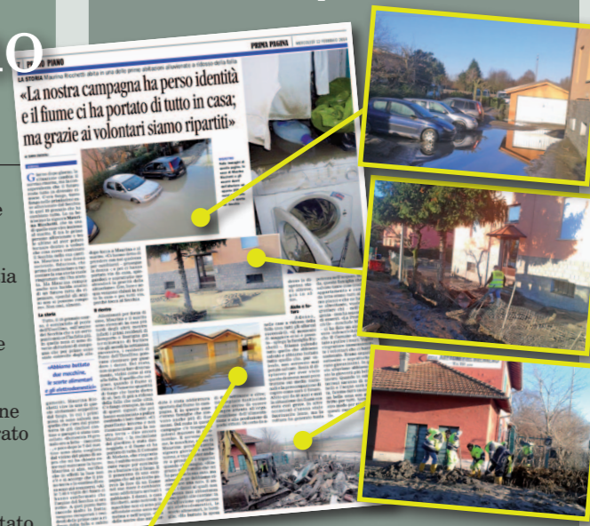
in queste foto il servizio di Prima Pagina del 12 febbraio sull'abitazione invasa dal fango con le foto scattate subito dopo l'alluvione. Nelle altre immagini gli stessi luoghi negli scatti del 25 gennaio durante i lavori di ripristino da parte dei volontari MoProC