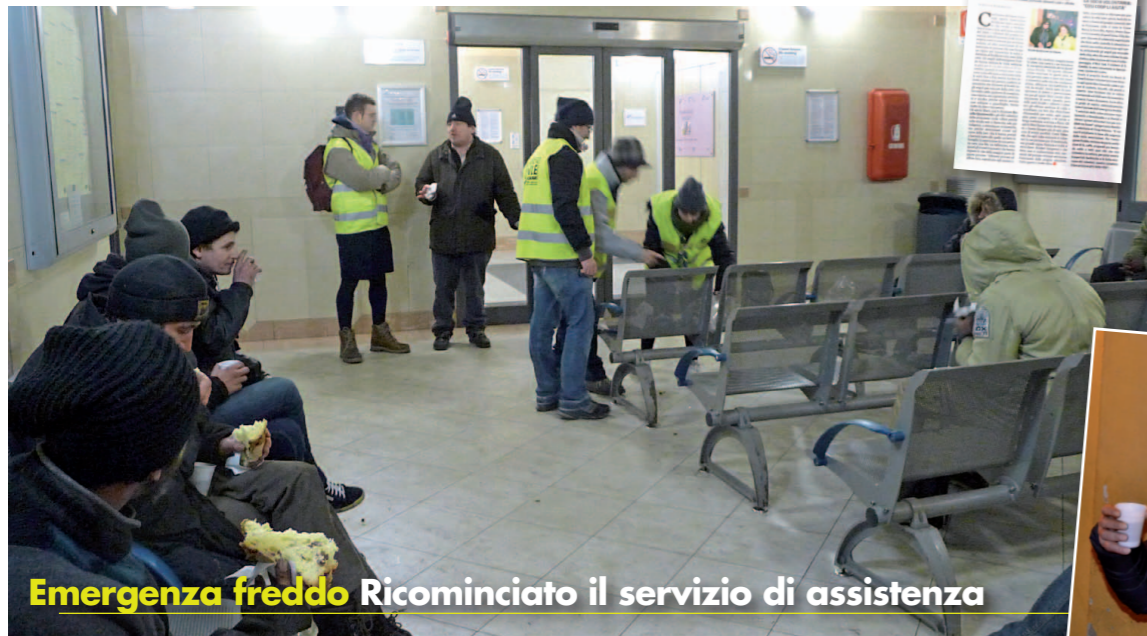
Emergenza freddo Ricominciato il servizio di assistenza