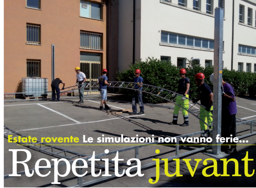
Estate rovente Le simulazioni non vanno ferie...