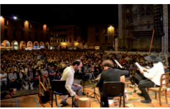
a sinistra e sopra una Piazza Grande gremita di persone in occasione di uno dei tanti incontri sotto a ogni ora del giorno si poteva assistere alle conferenze in programma a Modena, Carpi e Sassuolo in basso foto ricordo per i numerosi MoProc al concerto del 29 settembre al Palazzetto