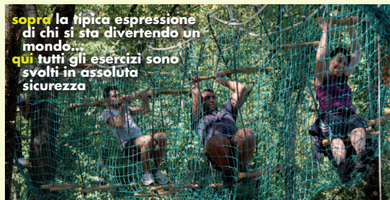
sopra la tipica espressione di chi si sta divertendo un mondo... qui tutti gli esercizi sono svolti in assoluta sicurezza