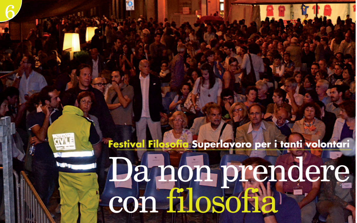
Festival Filosofia Superlavoro per i tanti volontari